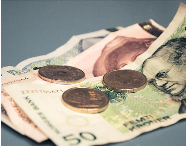
Kutt: Regjeringa har foreslått flere usosiale kutt i uførepensjonen.