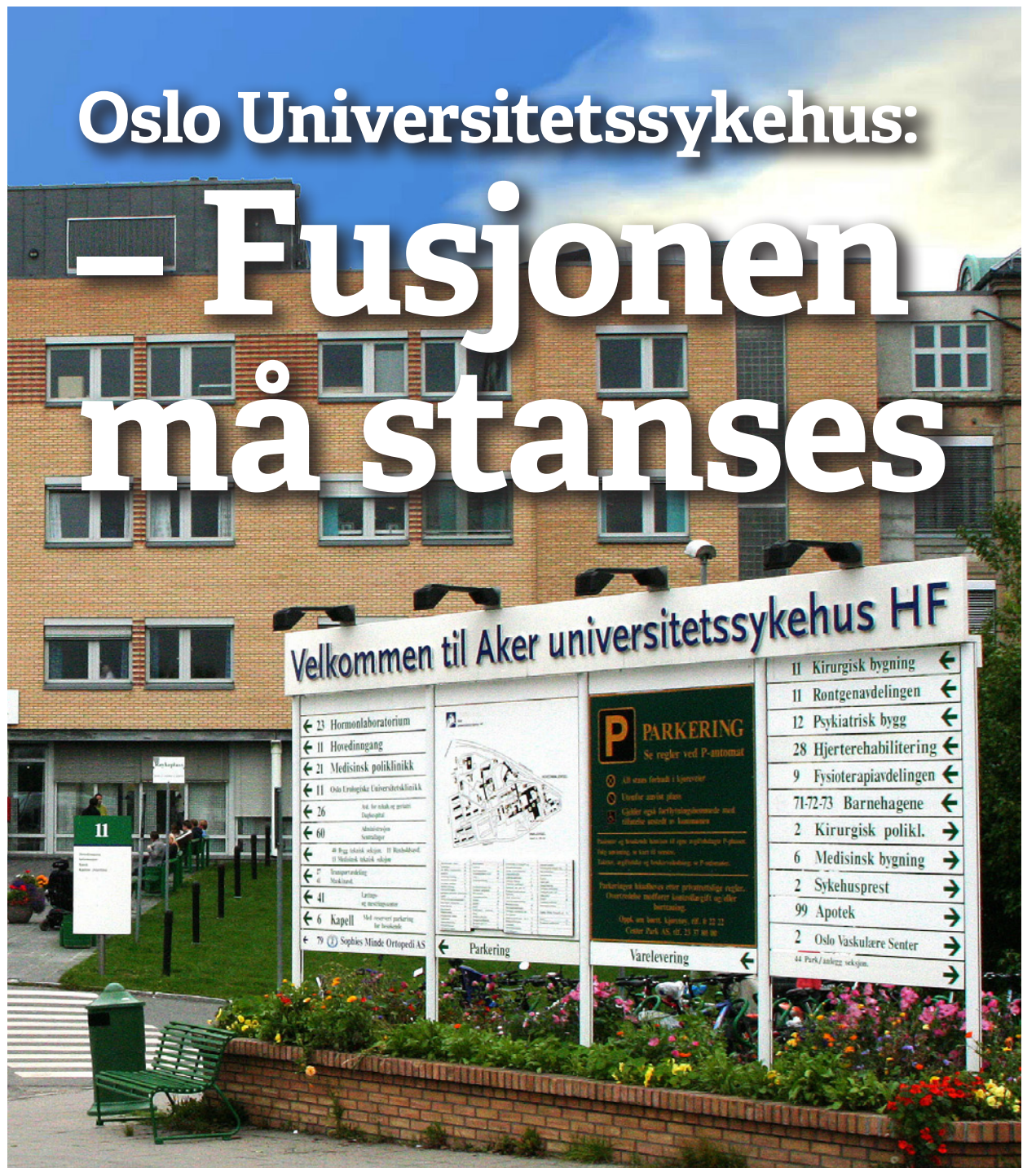
Aker sykehus: Motstanden mot nedleggelsen av Aker har vært stor fra første stund.

Bestill Forsvar dagens uføretrygd sin ferske brosjyre ved å sende en e-post til aksjon@uforepensjon.no