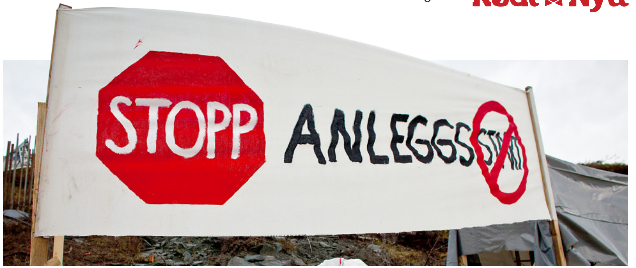
Anleggsstopp: Aksjonistar har hindra byggstart ved eit mastepunkt i hardanger.