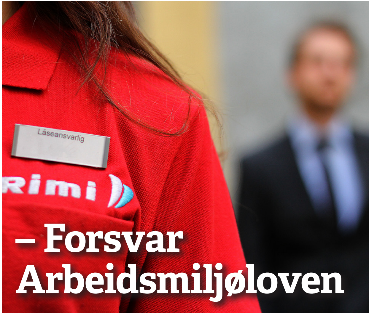
Under angrep: Unge tillitsvalgte reagerer på FrPs offensiv for å uthule Arbeidsmiljøloven.